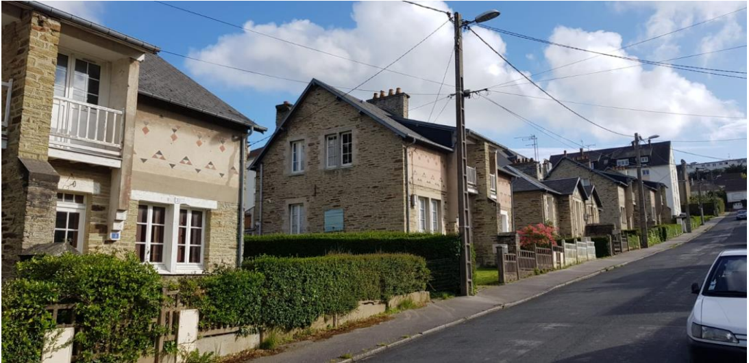
Rue du Dr Carré