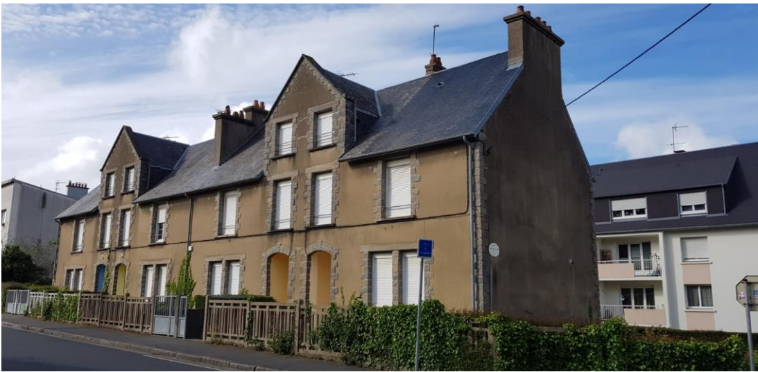
Rue de la Polle